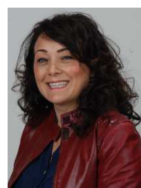
Emine Erdogan Facility Management